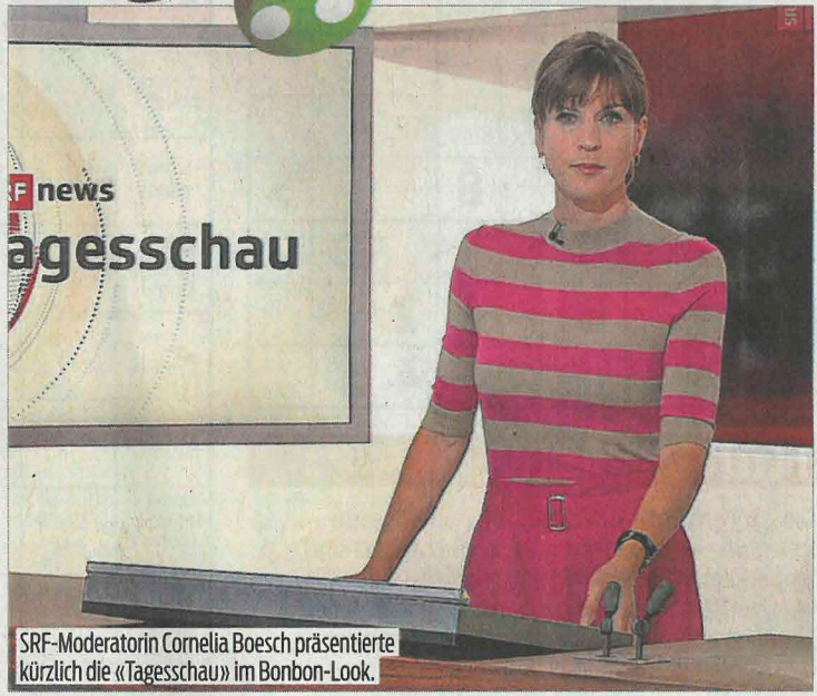
SRF-Moderatorin Cornelia Boesch präsentierte kürzlich die «Tagesschau» im Bonbon-Look.