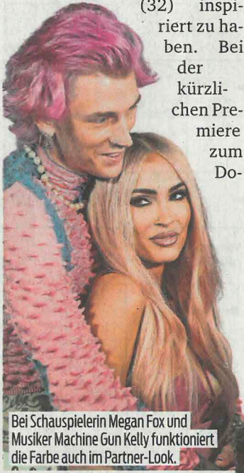
Bei Schauspielerin Megan Fox und Musiker Machine Gun Kelly funktioniert die Farbe auch im Partner-Look.